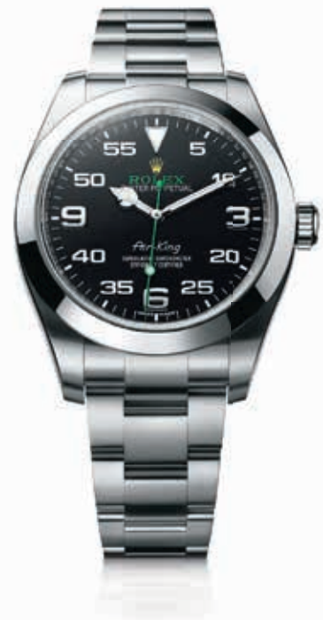
OYSTER PERPETUAL AIR-KING