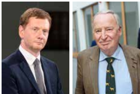
Ostsieger Sachsens CDU-Chef Kretschmer hat Probleme mit dem Erfolg von AfD-Chef Gauland

Wenn Kretschmer falsch taktiert, kann er viele Anhänger vergraulen. Diejenigen vom rechten Flügel, die ihn gewählt haben, können sich sobald nicht rächen. Aber im Nachbarland Thüringen wird aufmerksam beobachtet, was in Sachsen entschieden wird. Die unentschlossenen Wähler dort können noch reagieren. Sie wählen das Thüringer Parlament erst am 27. Oktober.